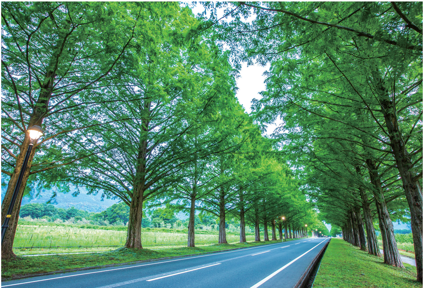
滋賀県 メタセコイア並木の新緑

県の木「もみじ」、郷土の花「しゃくなげ」、県の鳥「かいつぶり」、「地域の人々」、「琵琶湖の水」、そして「徳洲会のロゴ」をあしらい、自然豊かな滋賀県を、木をモチーフにあらわしました。「徳洲会のロゴ」の鳥が一羽その木にとまることで、滋賀県における地域医療の1ピースとして存在したいことを表現しています。